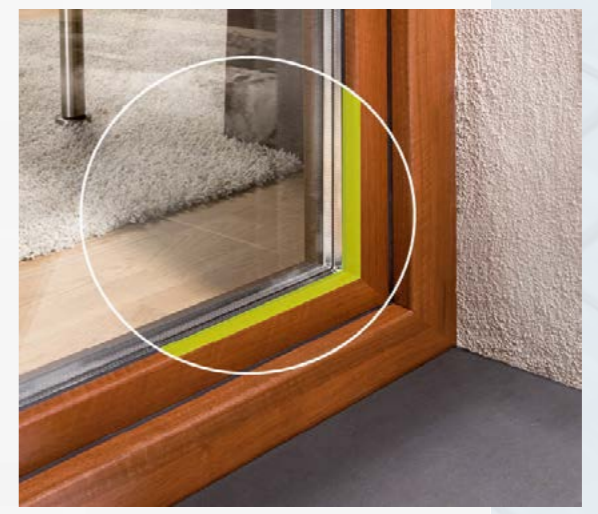
Statische Trockenverglasung STV®