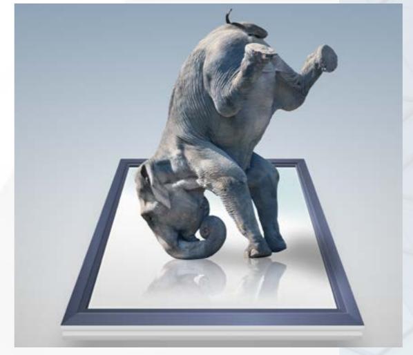
Statik auf höchstem Niveau